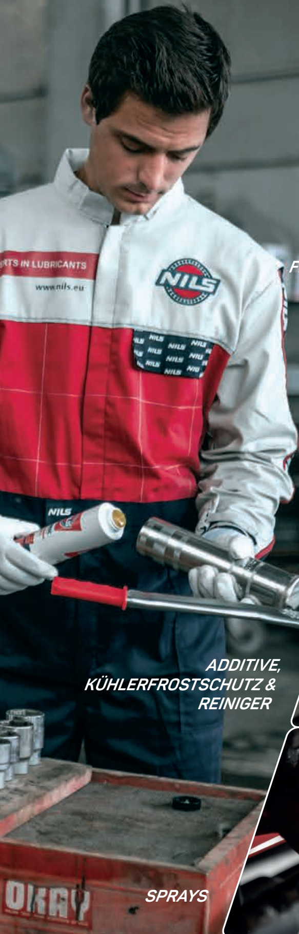
FETTE & PASTEN