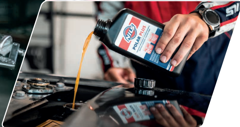
ADDITIVE, KÜHLERFROSTSCHUTZ & REINIGER